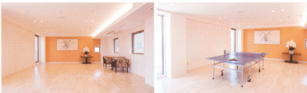
卓球や麻雀、パーティー等、多彩な楽しみ方が可能な「カルチャールーム4」(6F)