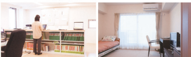
ケアステーション(4F)