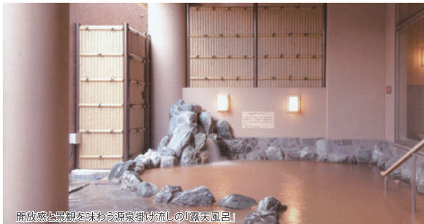
開放感と景観を味わう源泉掛け流しの「露天風呂」

蓮田オークプラザ駅前温泉館は医療・福祉・介護で培った30年の実績があり介護に携わるスタッフの約6割が国家資格保有者で24時間有人対応の介護付き老人ホームです。レストランや毎日ご利用いただける源泉掛け流しの天然温泉「琥珀の湯」、広々としたロビー&ラウンジ、蓮田駅のすぐ隣なので公共交通を利用したお出かけや、駅周辺でのショッピングなど快適な生活が送れます。