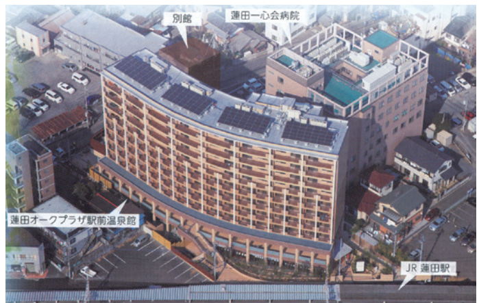
蓮田オークプラザ駅前温泉館